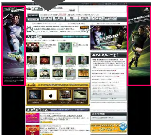
※その他の広告枠はセットではございません。