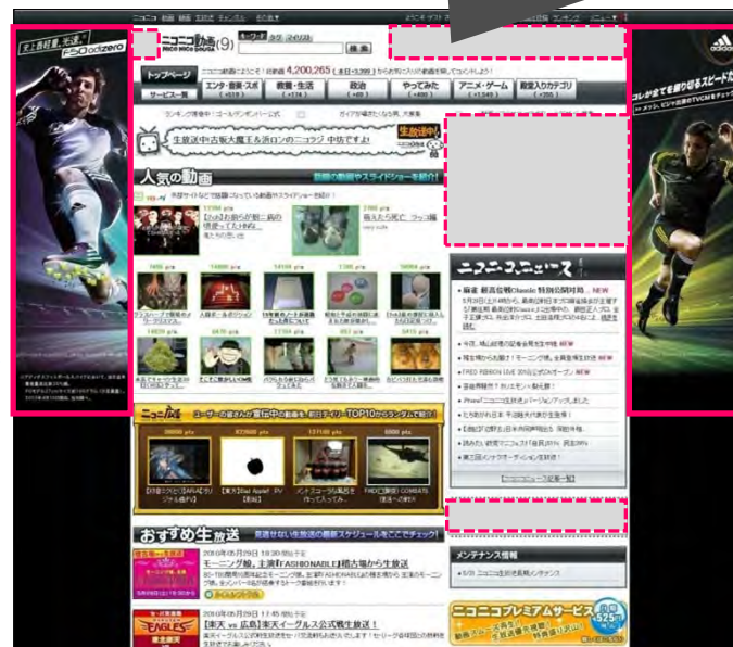
※サイドウォールの表示サイズはユーザーのPCの画面サイズに依存します。 ※サイトリニューアルにより、予告なくページレイアウトが変更となる可能性があります。

TOP面のその他のバナーを合わせてご購入いただくことで、よりジャックのような演出も可能です!!